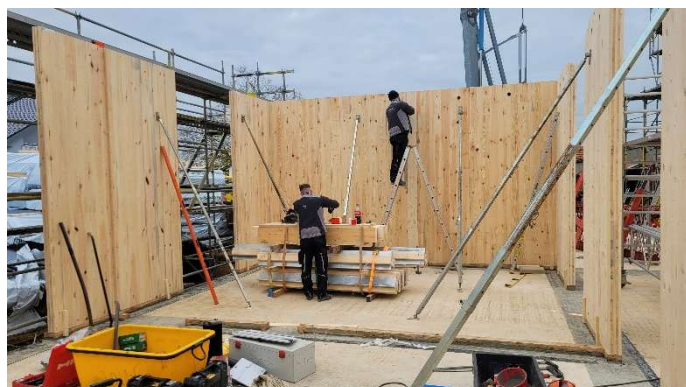
Benedikt Bauer 1. Bürgermeister