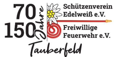
Benedikt Bauer 1. Bürgermeister

Der Festgemeinschaft Tauberfeld möchte ich an dieser Stelle gratulieren zu einem überaus berauschenden und gelungenen Fest. Weit über die Gemeinde hinaus hat es großen Anklang gefunden und für Begeisterung gesorgt. Herzlichen Dank dafür!