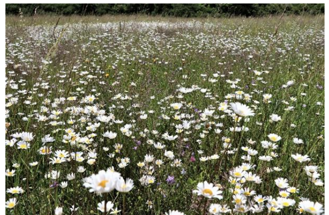
Margeritenblüte im Naturpark Altmühltal