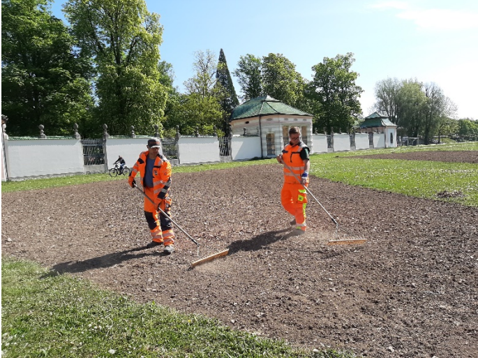
Vorbereitung der Flächen am Hofgarten in Eichstätt

zentrale Rolle spielen. In den kommenden Wochen sind weitere Veranstaltungen und Workshops mit unterschiedlichen Interessensgruppen geplant. Denn LEADER folgt auch bei der Erstellung der neuen regionalen Strategie dem bottom-up Ansatz: Das bedeutet, dass alle Bewohner und Bewohnerinnen der Region eingeladen sind, den Prozess aktiv mitzugestalten, in dem sie ihre Perspektiven, Anregungen und Vorschläge mitteilen. Weitere Informationen hierzu und zu kommenden Veranstaltungen finden Sie auf der Website der LAG Altmühl-Donau www.lag-altmuehl-donau.de .